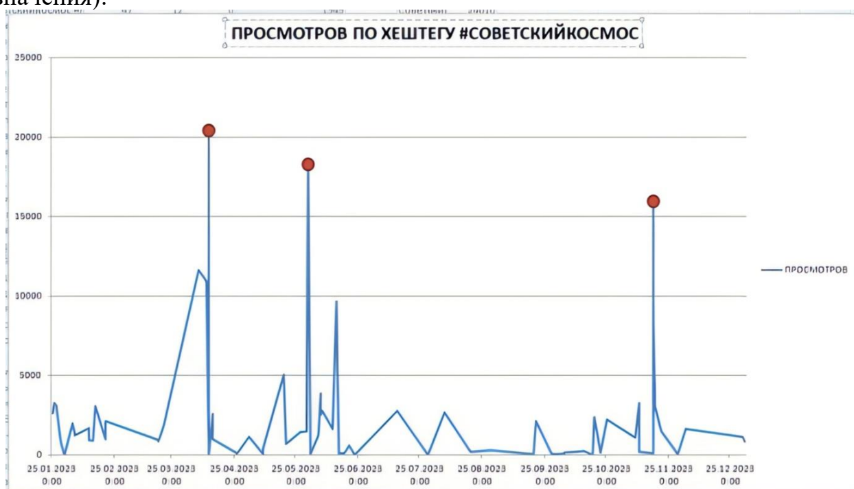
Рис. 1 (данные за 2023 календарный год)

Анализируя по указанной выше методологии хештег «#советский космос», мы получаем следующую картину просмотров, которую можно отобразить графически (красным отмечены интересующие нас пиковые значения):